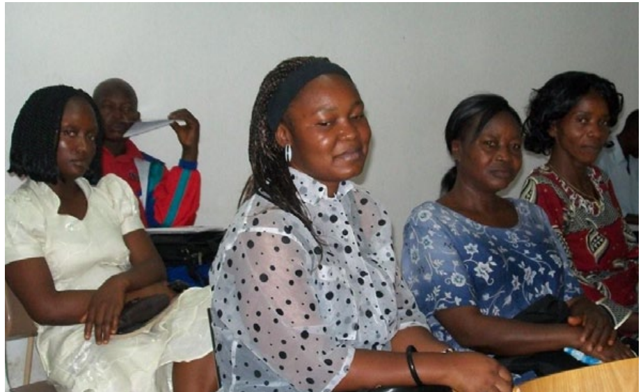
Första dagen i Grassfieldskola, september 2009.

Våra utbildningsinsatser i Liberia måste därför fortsätta med oförminskad kraft.