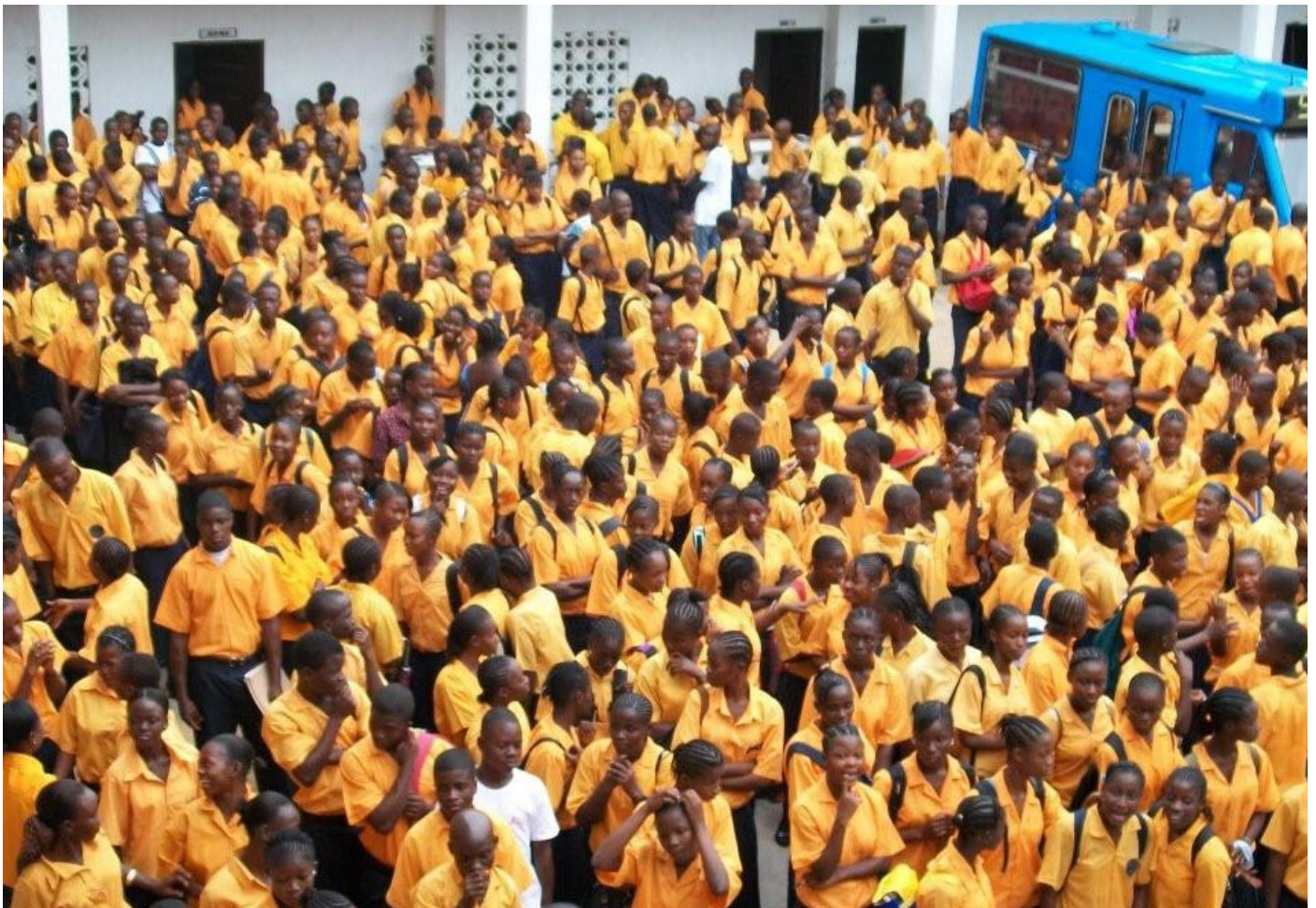
Första dagen i Grassfieldskola, september 2009