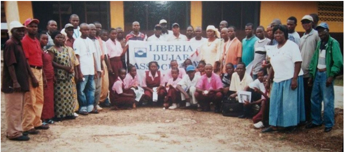
Participants at the workshop Gbelema public School Zeanzue

The Counseling Department has ended an enduring, successful year since it began operation in October 2008. During the year under review, the department was successful in having three outreach programs where a total number of 5180 persons were affected and a total of seven workshops conducted with a combined attendance of more than 2000 participants. This number quantifies a cognitive approach to Dujar's long standing commitment in harnessing the resolution of evolving problems of conflict and conflict-related nature as Liberia resurfaces from a decade-long civil arm scuffle.