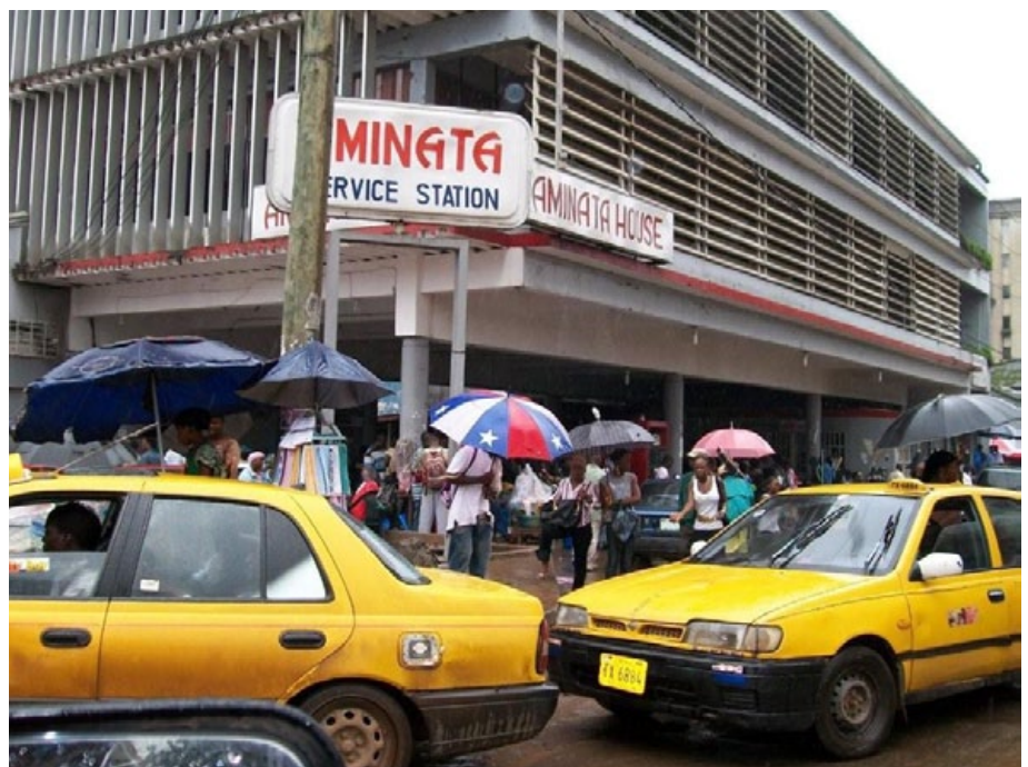
Rainy season in Liberia requires large umbrellas.

It can be recalled that the Ellen Johnson-led government assumed leadership inheriting an economy that was completely in shambles with a total breakdown of many if not all fabrics of society; a nation of endemic, economic backwardness, underpinned by corruption, "Number one public enemy." Upon assuming office, the government instituted series of staunch and informed sector reform policies in a bid to revive the nation.