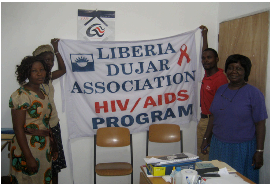
HIV AIDS projektgrupp LDA

Jag vill tacka för fyra mycket givande år av samarbete med LDA-Sverige och Liberia med ett HIV/AIDS-projekt och som för min del slutförd.