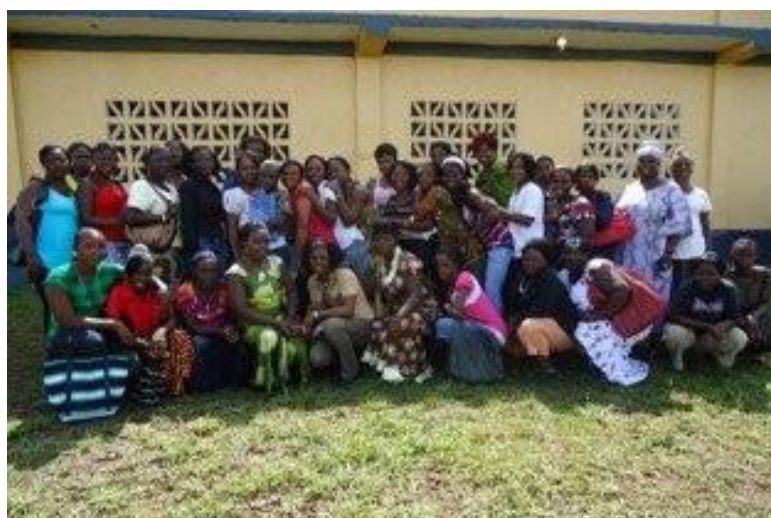
Studenter som firar öppnandet av Tekniska skolan

Liberia Dujar Associations första nyhetsbrev brukar alltid komma ut i mars varje år. Denna gång är vi sena. Vi hoppades att få meddela att Liberias utbildningsdepartement (Ministry of Education) hade godkänt Technical College TC som utbildningsanstalt, men inte förrän alldeles nyligen blev det klart! Den 13 april fick vi "Permanent Permit" av National Commission On Higher Education påskrivna certifikatet.