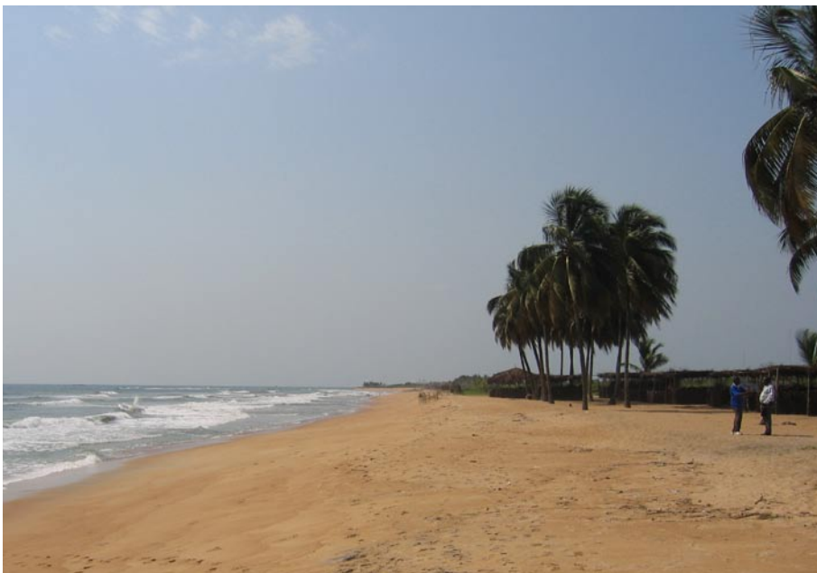
Stranden utanför Monrovia.

att skolan ger daglig sysselsättning till så många barn. Möjligheter till utbildning som kan ge ett framtida jobb. Skolan kan hjälpa många barn till stärkt självkänsla och självständighet, möjlighet att veta att man kan bli annat än barnsoldat. När jag läst rapporter och sett reportage från Liberia, där barn bara vet om ett yrke, soldat, har jag blivit skrämmd. Det är en helt förvrängd världs- och människobild som så många barn fått från sina militära ledare. Skrämmande att så många barn är så hjärntvättade!