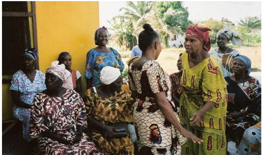
Kvinnor på äldrecentret

Att träffa de kvinnor som avslutat sitt år på centret och de som börjat vid årsskiftet var oerhört stimulerande, att se dem sitta och koncentrerat sy och brodera, ofta sjungande, att se dem lära sig läsa och räkna, att se deras glädje, gav en fantastisk känsla av att kunna ge dem förutsättningar till ett dragligare liv. Många av dem är mycket traumatiserade av de tunga krigsåren. Förändringen "att kunna skratta igen", som en kvinna uttryckte det. Den duktiga och oerhört engagerade personalgruppen, som med låga löner ger så mycket. Det var så berikande!