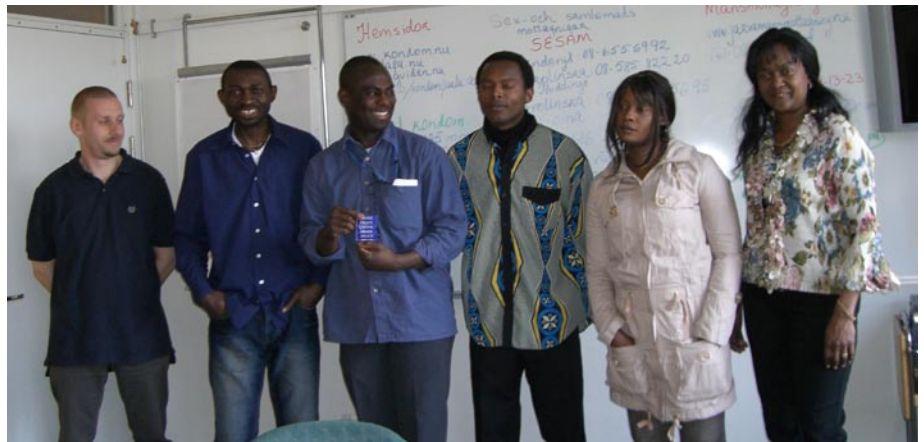
Young Adults, utbildning om kondomer.