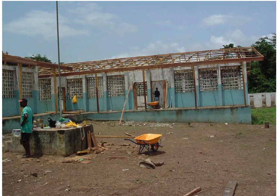
En av alla skolorna som LDA har återuppbyggt. Här bygger man tak.

Det svenska biståndet till Liberia går bland annat till insatser för utbildning, hälsovård och återuppbyggnad. De närmaste åren förväntas stödet öka. Under 2008 ska en samarbetsstrategi för Liberia utarbetas. Den ska ange omfattningen och riktlinjerna för utvecklingsarbetet de närmaste åren. Det är sannolikt att stödet till Liberia kommer att öka mycket. Demokrati, mänskliga rättigheter, infrastruktur och handel förväntas bli viktiga områden för det framtida stödet till Liberia, förutom sociala sektorer som utbildning och hälsa.