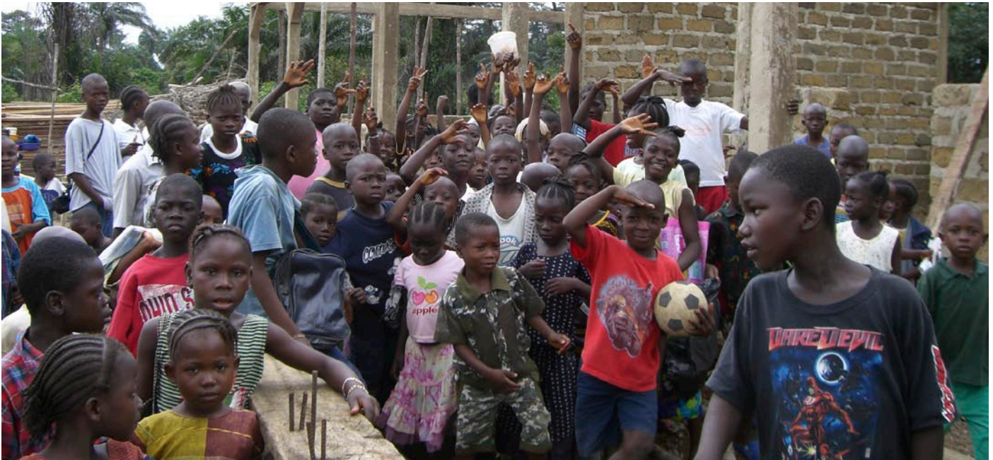
Barnen blir mycket glada när LDA kommer och bygger en skola i byn – en förutsättning för att utveckling ska komma till stånd.

LDA:s utbildningsverksamhet satsar vi också på hälsofrågor, demokrati, jämställdhet och mänskliga rättigheter. Allt detta ingår i utbildningen. LDA anser att ”utbildning är nyckeln till fred och utveckling”. LDA ser fram emot att utveckla sin verksamhet, som kan leda till en riktig demokrati och respekt för mänskliga rättigheter.