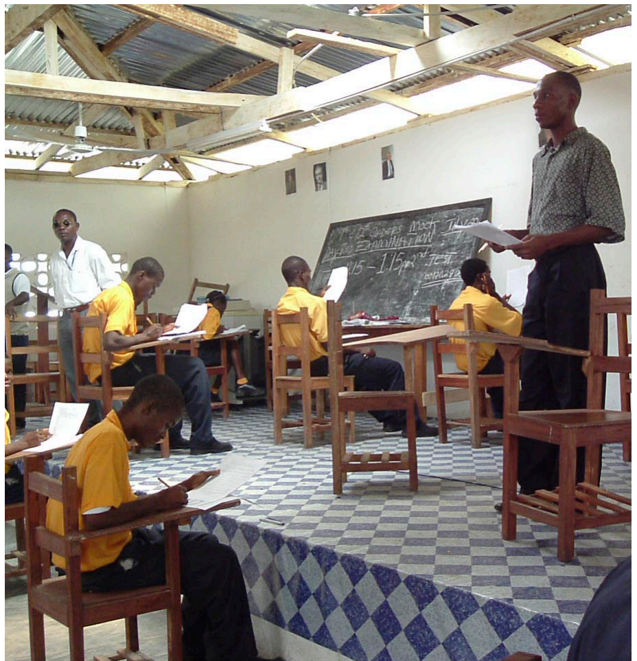
Det är viktigt med löner till lärarna. Inga löner - inga lärare.