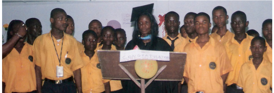
Graduation Program of the Principal, LDA High School