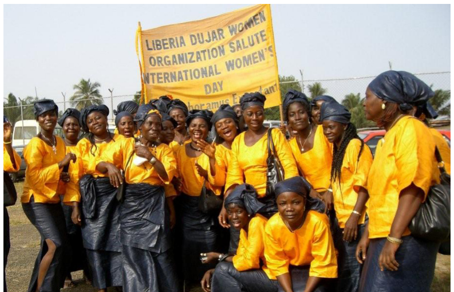
Liberia Dujar Women at Women Colloquium

Margaret Patane New York Stories 08-32 01 35