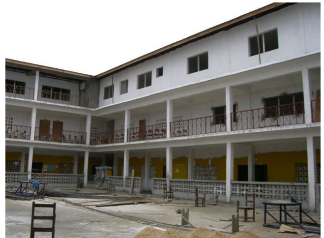
Grassfieldskolan i Monrovia, mars 2009