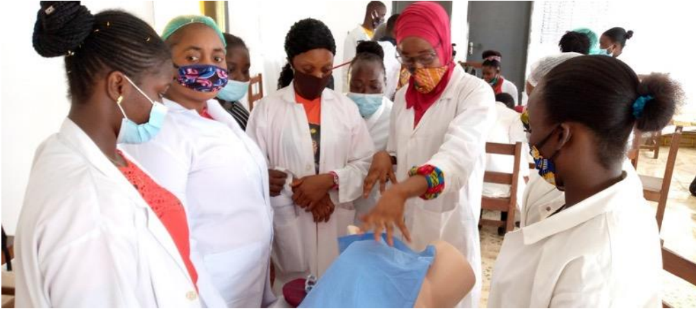
Lesson going on