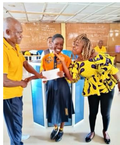
Någon från elevens familj är den som överlämnar hedersbetygelsen till respektive elev.

UTBILDNING är vägen till fred, frihet utveckling