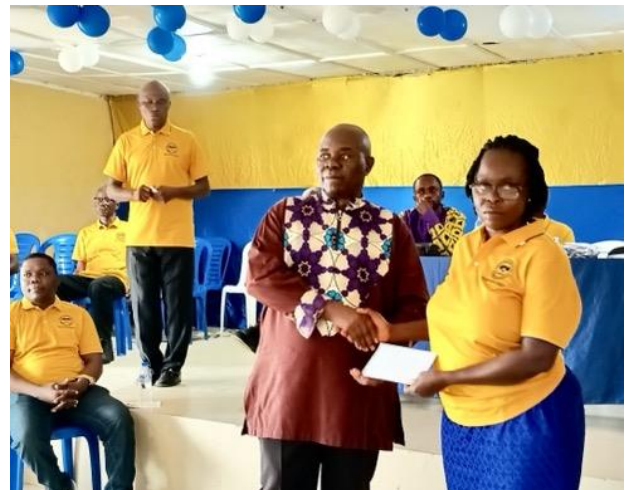
Alla lärarna fick var sin skriftlig hedersbetygelse.