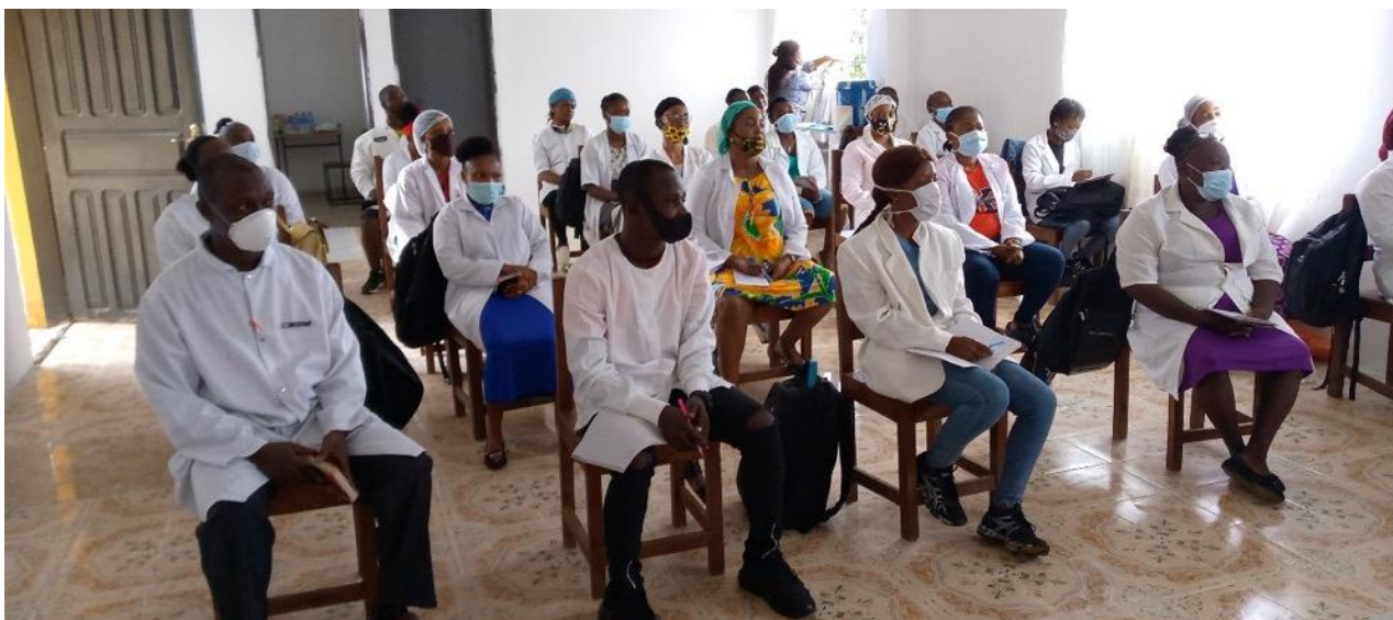
Week 1 - Midwifery students in simulation lab. Some students have left the program, leaving only 13.