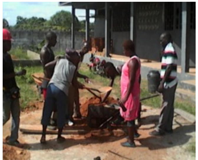
Making dirt bricks (betonghålstén för murning).