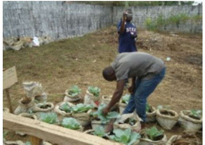
Nocal Agriculture students on practice at site

The Agricultural Department of the College has embarked on the small-scale breeding of pigs at the College. According to the Dean, Aaron Blackie, the Department is keen on teaching the students on how animal production is done with the introduction of the piggery. He said besides the piggery, the students are engaged in crops multiplication at the farm of the Department some 8 miles from the main campus.