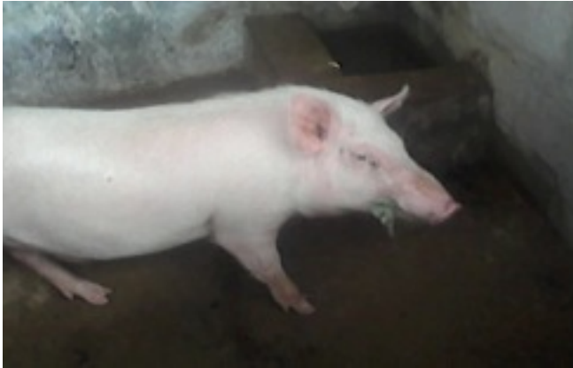
Lantbruksundervisning på Technical College