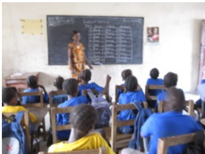
Literacy Program för barn som inte går i skolan

LDA's Grassfield School ligger i Gardnersvilles kommun. Sedan 2006 har kommunen påmint LDA om att inte glömma att starta ett "Literacy and Adult Educational Program" där. Efter att ha blivit påmind varje år om program för flickor, ansökte LDA via Musikhjälpen genom Radiohjälpen om stöd till detta sedan länge diskuterade och efterlängtdade läs- och skrivkunnighetsprogram för flickor i åldrarna 7-19 år. Ansökan beviljades, 75 flickor antogs och 2013 startade kurserna. Emellertid blev det ett visst bortfall beroende på att några flyttade, några blev sjuka och andra försvann av andra skäl. Men 68 flickor genomgick ändå utbildningen.